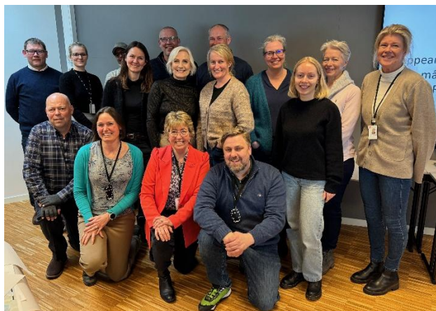
Fagpersoner fra kommunene som inngår i de regionale teamene; regionalt ATP- team, regionalt næringsteam og regionalt klima- og miljøteam.

De regionale fagteamene har sendt inn en kort redegjørelse for sin aktivitet i 2025.