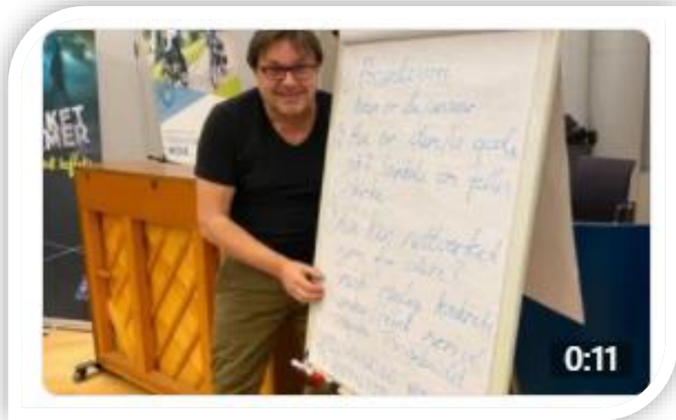
Erik Larsen Informasjonstjenester